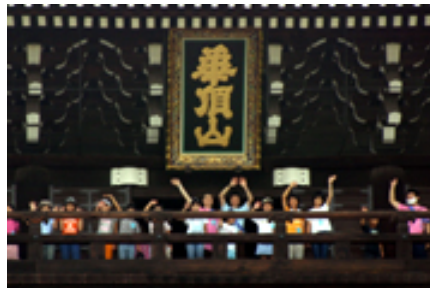
知恩院山門に登る