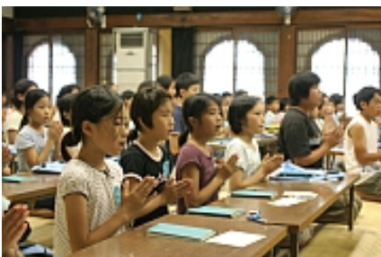
南無阿弥陀仏の練習風景